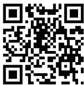
Google 表單 QR Code

報名辦法：1. 2026年4月14日(星期二)開始接受報名； 機構須填寫 Google 表單，並透過 Google 表單上載機構同意書(附件 1)及機構報名表(附件 5)為運動員進行報名。